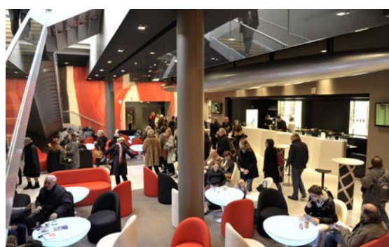
Bar du théâtre