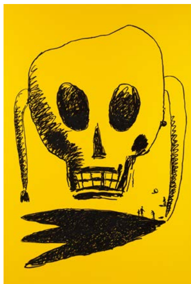
Paysage jaune 2008 Acrylique sur toile 300 x 200 cm