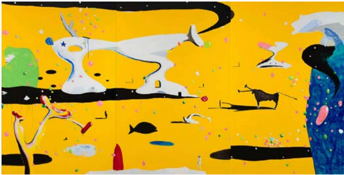
Cosmogarden-city-21 century 2008 Acrylique sur toile 300 x 600 cm