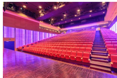
Salle de spectacle