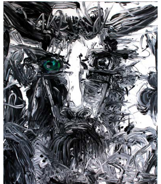
Minotaure oeil bleu 2015 Acrylique sur toile 190 x 160 cm