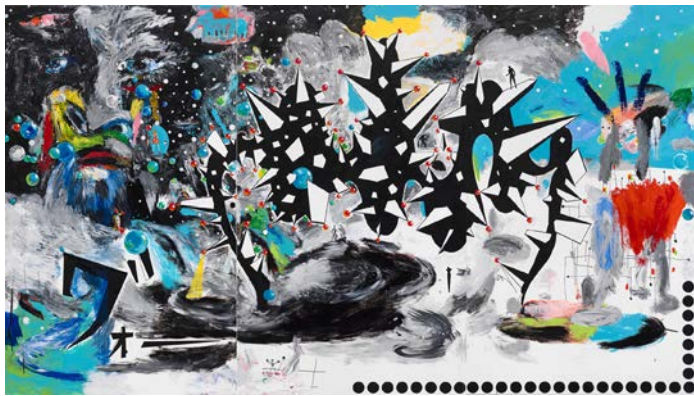
Sans titre 2013 Technique mixte sur toile 270 x 480 cm