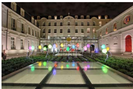
Parvis du théâtre

Le Théâtre des Sablons, inauguré en janvier 2013, est un nouveau pôle culturel de la ville de Neuilly-sur-Seine. Il regroupe une salle de spectacle, un espace d'exposition, un auditorium, des studios de musique, des salles d'activités et offre une programmation pluridisciplinaire tout au long de l'année.